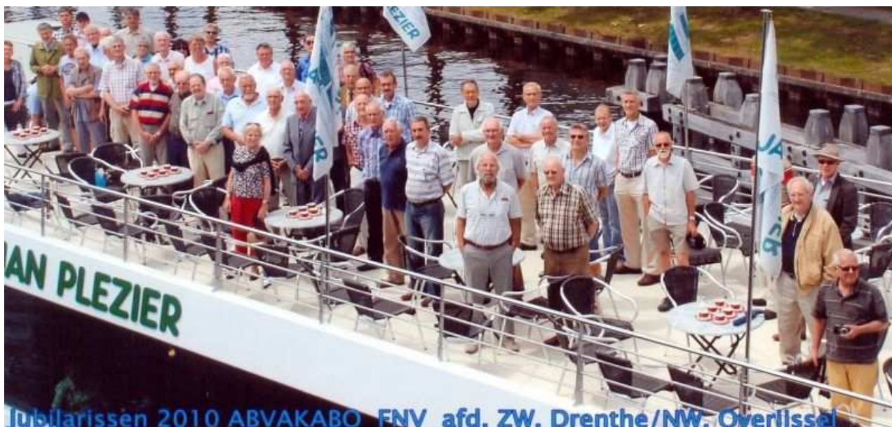
Jubilarissen aan boord van de rondvaartboot.